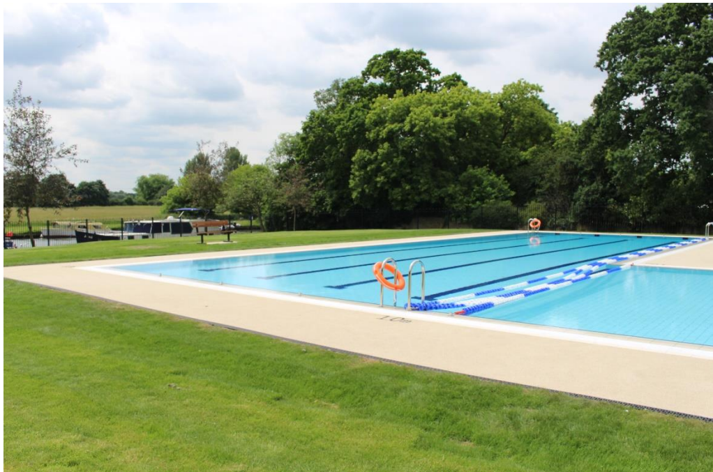
استخر روباز Abingdon

Meadow در طول فصل تابستان باز می شود. در هوای گرم، باید از قبل رزرو کنید. برای آخرین به روز رسانی ها از وب سایت ما دیدن کنید: whitehorsedc.gov.uk/abbeymeadow