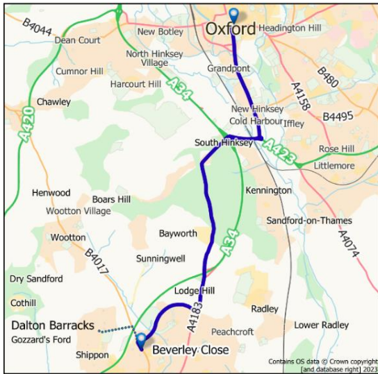
بس سرويس X1 ښار بېورلي کلوز تر آکسفورډ