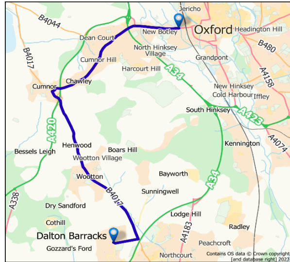
بس سرويس 33: ډالټن بارکز تر آکسفورډ

ټکسي شرکت - د کورله دروازي مو تر منزله رسولو خدمات چې شامل د: